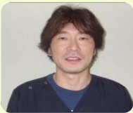
医局 専門家: 消化器内 科

今年の春も新入職員が入社いたしました。 学校で多くのことを学んだ新卒の職員や、医療・介護 業界で経験を積んできた職員たちです。